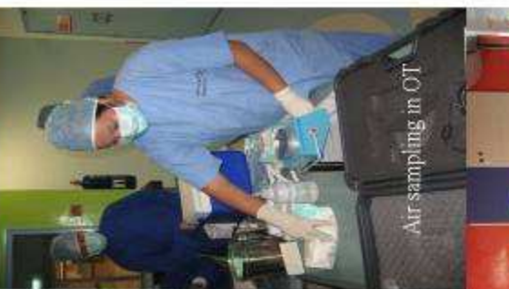
Air sampling in OT