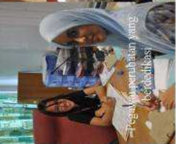
Pegawai perubatan yang berdedikasi