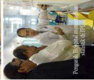
Pengarah Hospital meninjau status di JPL