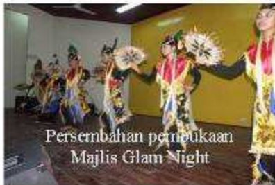
Persembahan pembukaan Majlis Glam Night

Kemuncak Hari Keluarga adalah pada malam 17 Disember 2009. Majlis sambutan Hari Keluarga kali ini diadakan di Dewan Serbaguna Daerah Pitas. Dengan bertemakan Glam Global ,