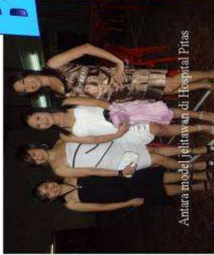
Antara model jelitawan di Hospital Pitas