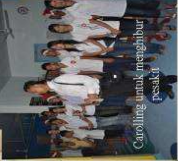
Caroling untuk menghibur pesakit