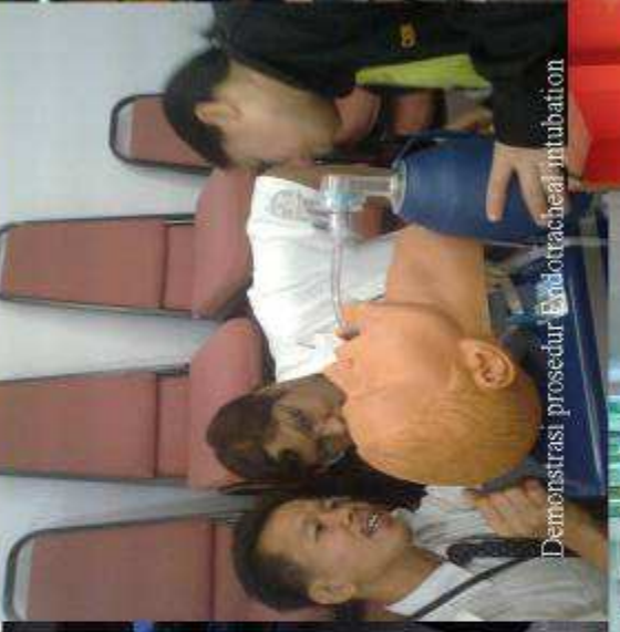
Demonstrasi prosedur Endotracheal intubation