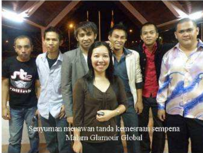
Senyuman menawan tanda kemesraan sempena Malam Glamour Global

Hari Keluarga 2009 anjuran Kelab Sosial dan Kebudayaan Hospital Pitas disambut dengan begitu meriah pada 17 Disember 2009 dengan disertai seluruh warga hospital termasuk kakitangan Faber Mediserve. Hari Keluarga kali ini mendapat tajaan beberapa syarikat pembekal Hospital Pitas. Dengan persediaan yang begitu singkat, para AJK Hari Keluarga bertungkus- lumus membuat persediaan. Pelbagai acara seperti pertandingan mewarna bagi kanak- kanak, tarik tali, perlawanan bola tampar, bola sepak, ping- pong dan sepak takraw telah diadakan. Selain itu, terdapat juga acara sukaneka bagi kanak- kanak. Acara dan permainan ini bertu-