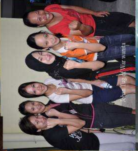
Johan Tug of War wanita