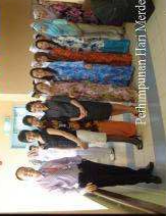
Pedumpunan Hari Merdeka di aras 2 blok perubahan