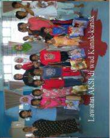
Lawatan AKSI di wad Kanak-kanak