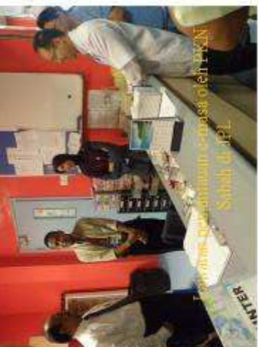
Antara perubatan di Hospital Pitas Sabtu 20/11