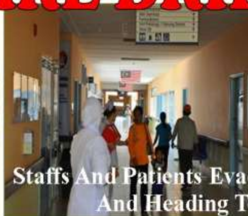
Staffs And Patients Evacuating Hospital Building And Heading To Assembly Point