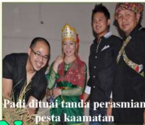
Padi dituai tanda perasmian pesta kaamatan