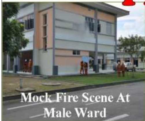
Mock Fire Scene At Male Ward