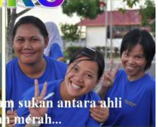
Biru, Kuning, Merah, Hijau beraksi dalam sukan antara ahli SMRC dan juara adalah rumah merah...