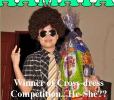
Winner of Cross-dress Competition... He-She??