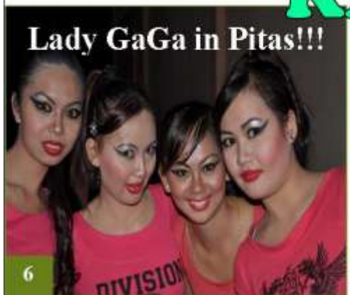
Lady GaGa in Pitas!!!