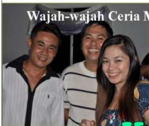
Wajah-wajah Ceria Malam Kaamatan 2010