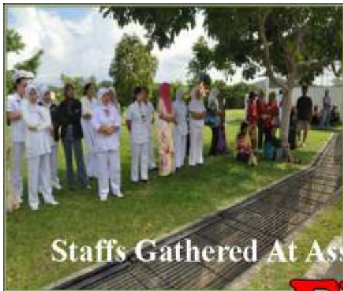
Staffs Gathered At Assembly Point 'A' Waiting For Further Instruction