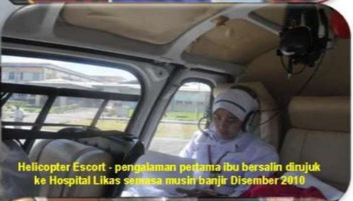
Helicopter Escort - pengalaman pertama ibu bersalin dirujuk ke Hospital Likas semasa musin banjir Disember 2010