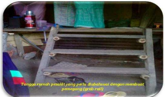
Tangga rumah pesakit yang perlu diubahsuai dengan membuat pemegang ( grab rail )