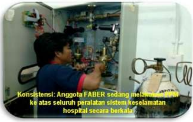
Konsistensi: Anggota FABER sedang melakukan PPM ke atas seluruh peralatan sistem keselamatan hospital secara berkala