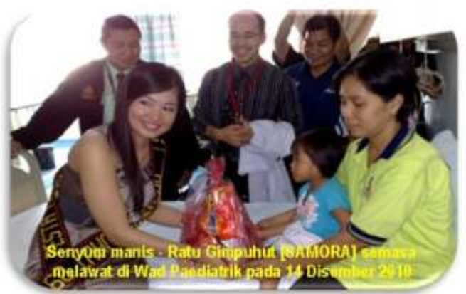
Senyum manis - Ratu Gimpuhut (SAMORA) semasa melawat di Wad Paediatric pada 14 Disember 2010