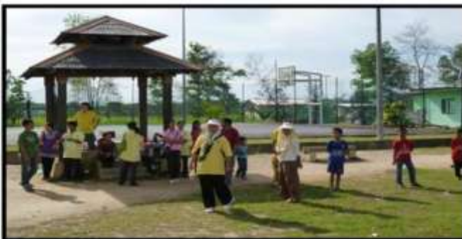
Kiri: Pertandingan sukaneka [tendang belon tutup mata] oleh kanak-kanak AKSI Hospital Pitas dan NGO, sangat meriah.