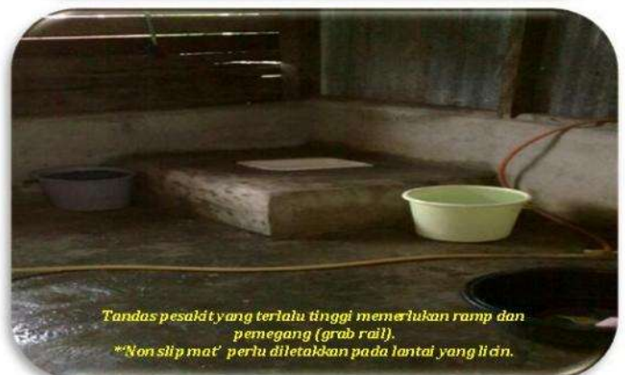
Tandas pesakit yang terlalu tinggi memerlukan ramp dan pemegang ( grab rail ). * Non slip mat perlu diletakkan pada lantai yang licin.