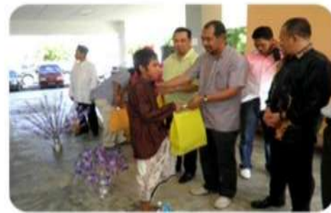
Pemberian cendera kenangan kepada semua peserta berkhatan.

"Senyuman sempat diberikan oleh kanak-kanak ini sebelum berkhatan"