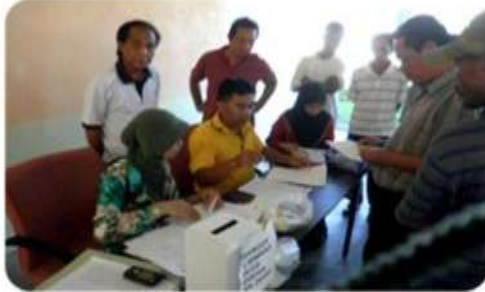
Ibubapa sedang mendaftarkan anak-anak di kaunter pendaftaran.