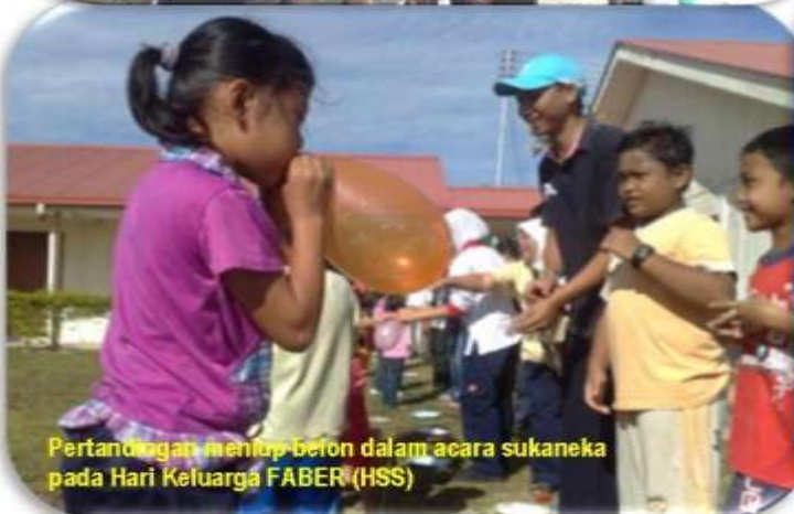
Pertandingan meniup belon dalam acara sukaneka pada Hari Keluarga FABER (HSS)