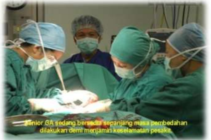
Senior GA sedang berada sepanjang masa pembedahan dilakukan demi menjamin keselamatan pesakit.