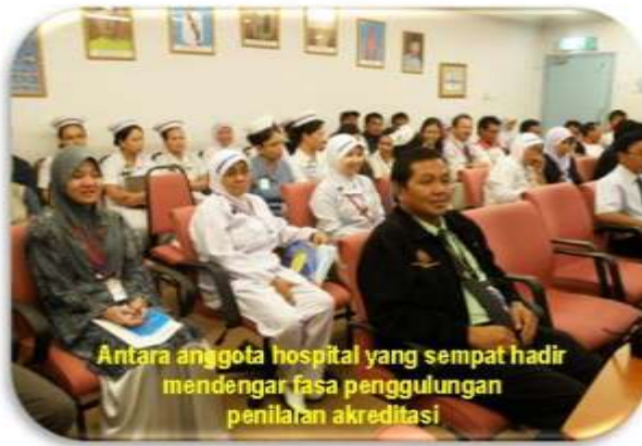
Antara anggota hospital yang sempat hadir mendengar fasa penggulungan penilaian akreditasi

Berita & Peristiwa Sana Sini Berita & Peristiwa Sana Sini Berita & Peristiwa Sana Sini Berita & Peristiwa Sana Sini