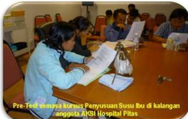
Pre-Test semasa kursus Penyusuan Susu Ibu di kalangan anggota AKSI Hospital Pitas