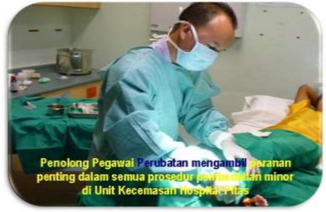
Penolong Pegawai Perubatan mengambil peranan penting dalam semua prosedur perubatan minor di Unit Kecemasan Hospital Pitas