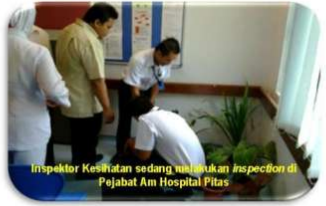
Inspektor Kesihatan sedang melakukan inspection di Pejabat Am Hospital Pitas