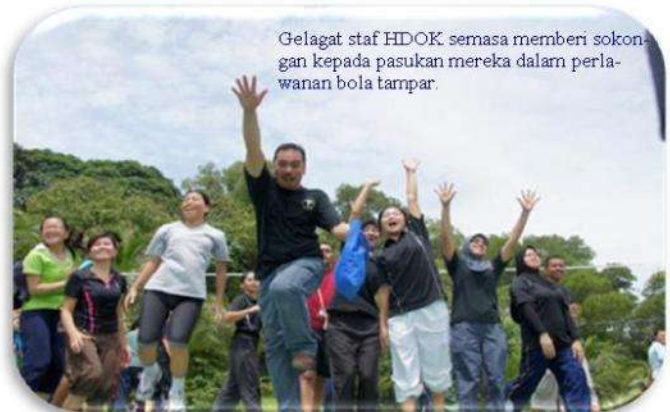
Gelagat staf HDOK semasa memberi sokongan kepada pasukan mereka dalam perlawanan bola tampar.

Secara keseluruhannya, lawatan ini berjaya memupuk silaturahin antara kakitangan Hospital Pitas dan HDOK. Para peserta rombongan mengucapkan setinggi-tinggi terima kasih kepada pihak Hospital Duchess Of Kent Sandakan di atas sambutan yang meriah dan layanan mesra yang telah diberikan.