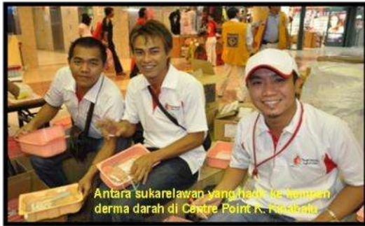
Antara sukarelawan yang hadir ke kempen derma darah di Centre Point K. Pankajali

Tahun 2010 merupakan satu tahun yang mencabar bagi Unit Transfusi Darah Hospital Pitas. Banyak kempen telah dijalankan di sekitar kawasan Daerah Pitas sehingga ke Daerah Sugud Beluran untuk memastikan bekalan darah di hospital sentiasa mencukupi.