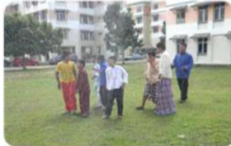
Semburan air ke atas anak-anak sebelum khatan dijalankan.