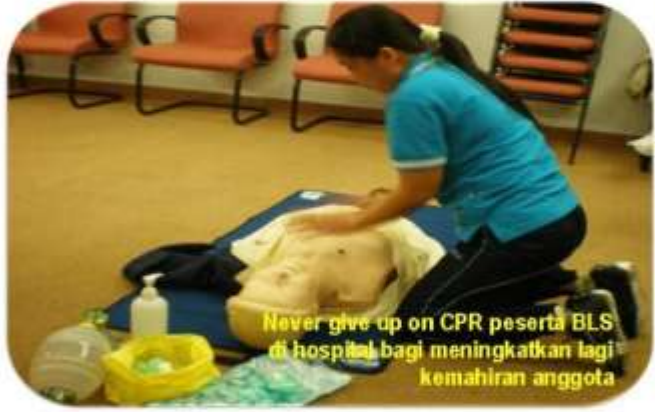
Never give up on CPR peserta BLS di hospital bagi meningkatkan lagi kemahiran anggota