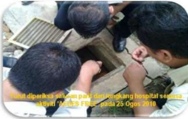
Mulut diperiksa sebelum paut dan longkang hospital semasa aktiviti 'MILES FREE' pada 25 Ogos 2010

Berita & Peristiwa Sana Sini Berita & Peristiwa Sana Sini Berita & Peristiwa Sana Sini Berita & Peristiwa Sana Sini