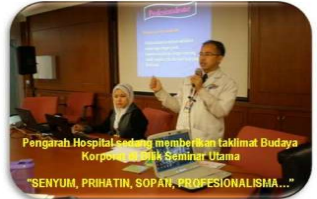
Pengarah Hospital sedang memberikan taklimat Budaya Korporat di Bilik Seminar Utama

"SENYUM, PRIHATIN, SOPAN, PROFESIONALISMA..."