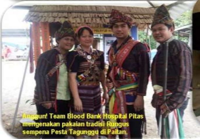
Anggun! Team Blood Bank Hospital Pitas mengenakan pakaian tradisi Rungus sempena Pesta Tagunggu di Paitan.