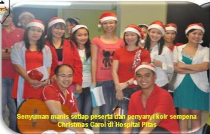
Senyuman manis setiap peserta dan penyanyi koir sempena Christmas Carol di Hospital Pitas