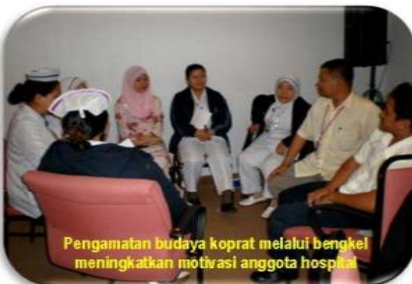
Pengamatan budaya koprart melalui bengkel meningkatkan motivasi anggota hospital

"SENYUM, PRIHATIN, SOPAN, PROFESIONALISMA..."