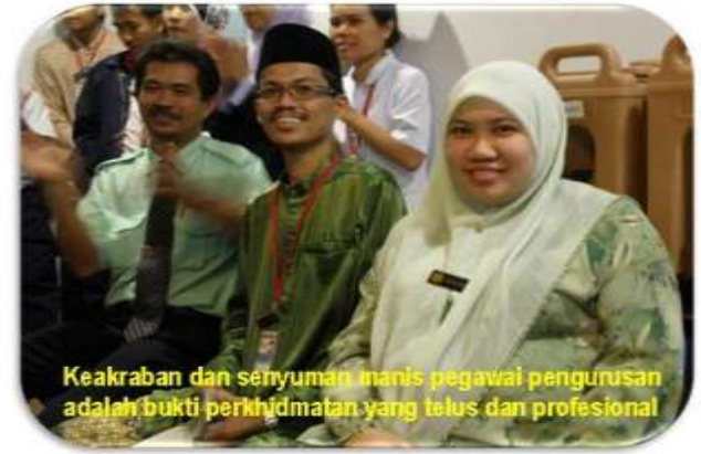
Keakraban dan senyuman manis pegawai pengurusan adalah bukti perkhidmatan yang telus dan profesional