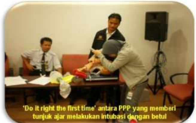
'Do it right the first time' antara PPP yang memberi tunjuk ajar melakukan intubasi dengan betul