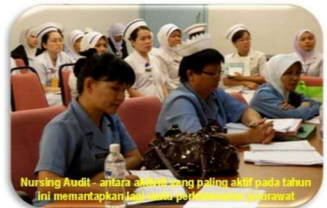
Nursing Audit - antara aktiviti yang paling aktif pada tahun ini memantapkan lagi mutu perkhidmatan rawat