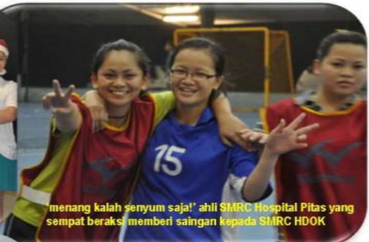
menang kalah senyum saja! ahli SMRC Hospital Pitas yang sempat beraksi memberi saingan kepada SMRC HDOK