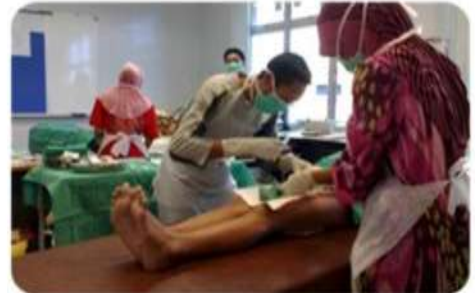
Para petugas sedang sibuk menjandakan 'circumcision'.