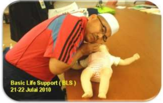
Basic Life Support ( BLS ) 21-22 Julai 2010