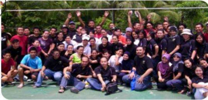
Staf HDOK dan ahli-ahli SMRC Pitas bergambar kenang-kenangan.

"Disahkan bahawa seramai 50 orang ahli SMRC Pitas telah meninggalkan Daerah Pitas disebabkan perkara yang tidak dapat dipastikan dan masih dalam siasatan"