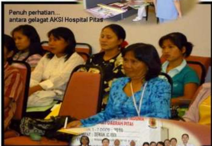
Penuh perhatian... antara gelagat AKSI Hospital Pitas

Syabas kepada semua ahli AKSI yang telah hadir ke majlis ini yang telah memberikan sokongan secara langsung dan tidak langsung untuk menjana minda masyarakat tempatan ke arah minda positif dan sihat.