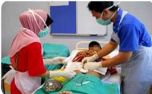
Petugas sedang memberi pendidikan kesihatan tentang cara penjagaan luka pembedahan.