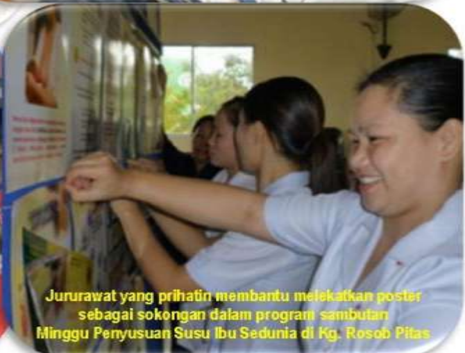
Jururawat yang prihatin membantu melekatkan poster sebagai sokongan dalam program sambutan Minggu Penyusuan Susu Ibu Sedunia di Kg. Rosob Pitas