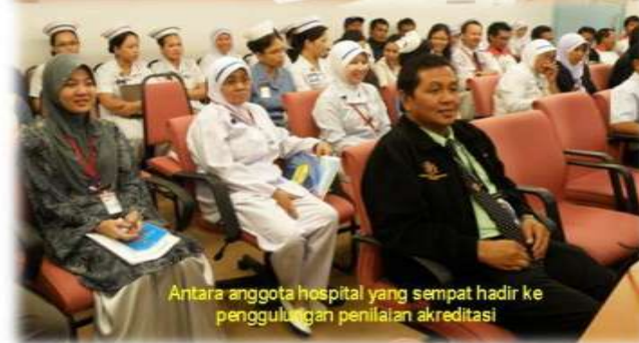
Antara anggota hospital yang sempat hadir ke penggulungan penilaian akreditasi

Tempoh 3 hari berkenaan merupakan tempoh yang sangat bermakna bagi warga Hospital Pitas yang majoritinya dianggotai oleh kakitangan yang agak baru dalam perkhidmatan. Pada saat ini warga Hospital Pitas ibarat bertungkus lumus 24 jam sehari bagi memenuhi segala persoalan yang diajukan oleh pihak panel penilai. Pelbagai komen, teguran dan tidak kurang juga pujian yang diberi diharap dapat memberikan pengalaman berguna bagi kakitangan Hospital Pitas di masa-masa akan datang.