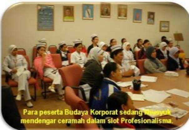
Para peserta Budaya Korporat sedang masyuk mendengar ceramah dalam slot Profesionalisma.